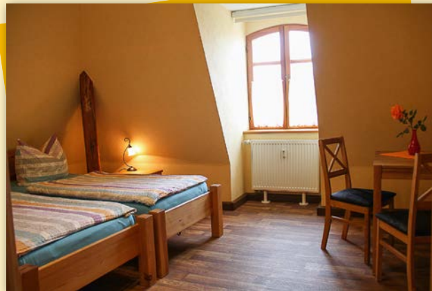
Zweibettzimmer 24 qm