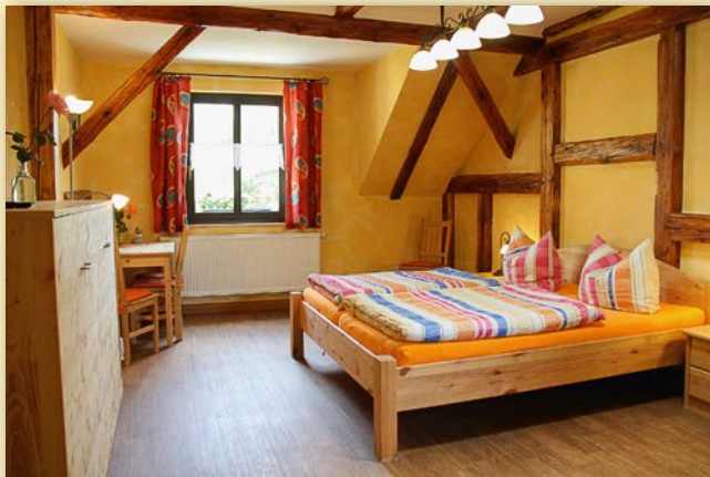
Appartement 30 qm