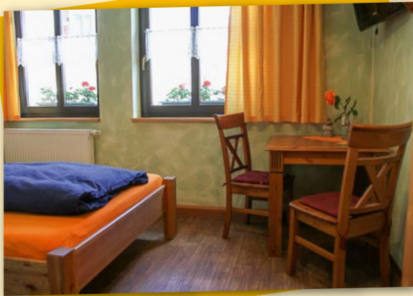
Einzelzimmer 17 qm