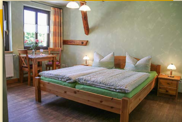
Doppelzimmer 21 qm